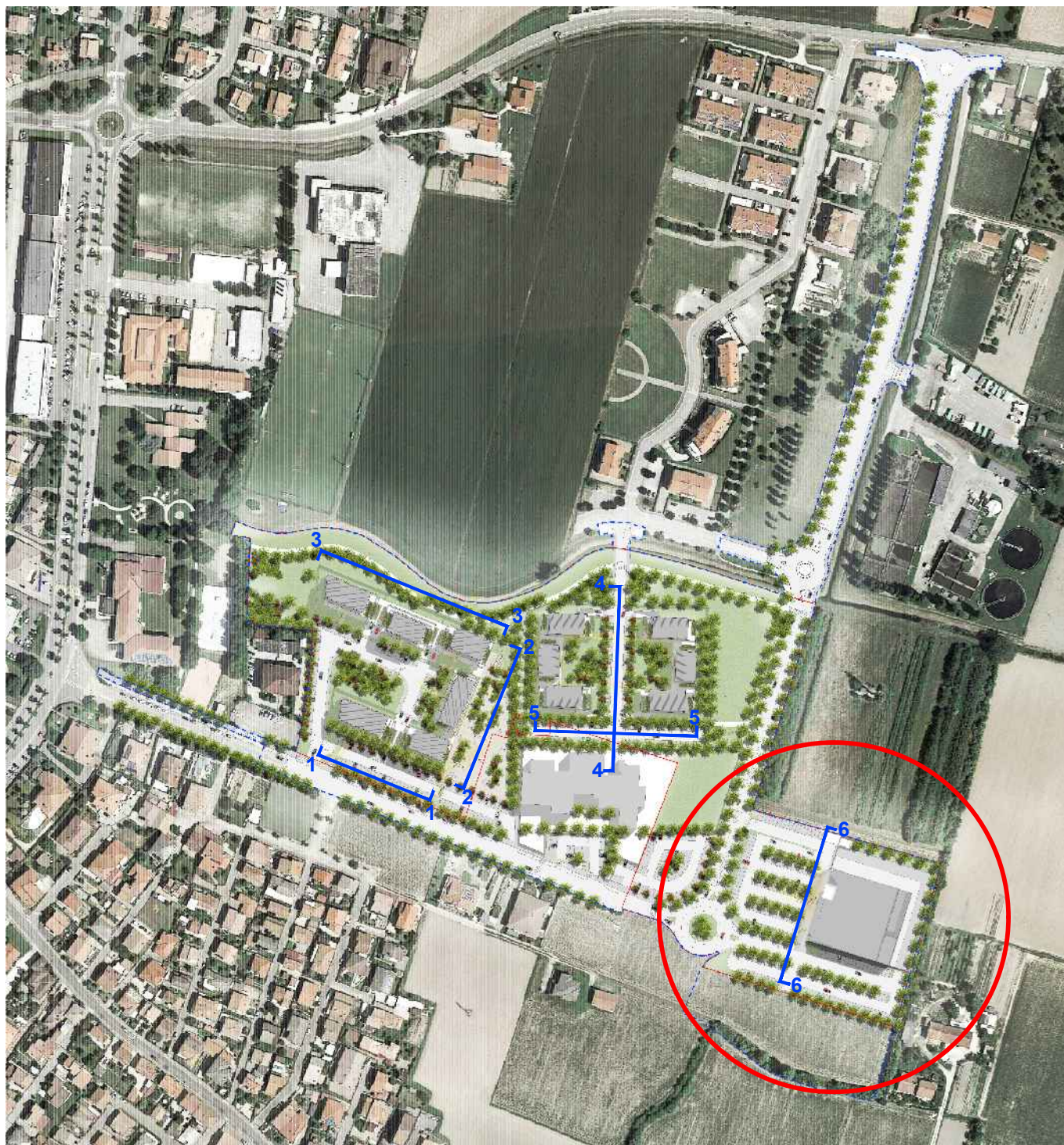
PLANIMETRIA CON INDIVIDUAZIONE DEI PROFILI