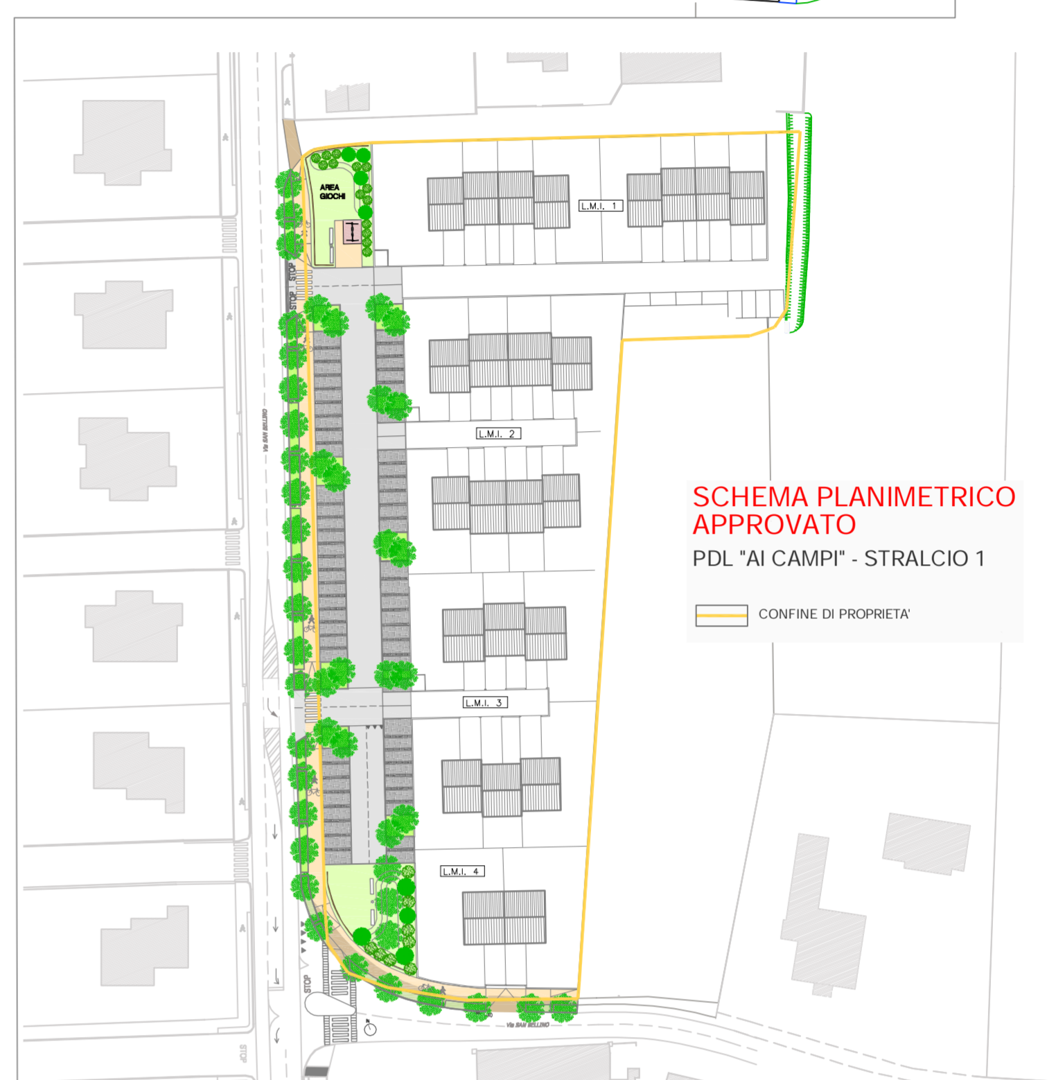
SCHEMA PLANIMETRICO APPROVATO PDL "AI CAMPI" - STRALCIO 1 CONFINE DI PROPRIETA'