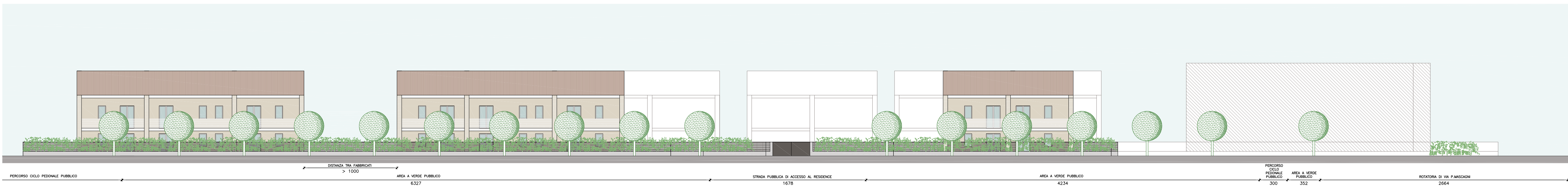
SEZIONE PROFILO OVEST-EST